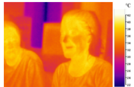
Изображение девушки, полученное в инфракрасном диапазоне

Инфракрасная термография, тепловое изображение или тепловое видео — это научный способ получения термограммы — изображения в инфракрасных лучах, показывающего картину распределения температурных полей. Термографические камеры или тепловизоры обнаруживают излучение в инфракрасном диапазоне электромагнитного спектра (примерно 900—14000 нанометров) и на основе этого излучения создают изображения, позволяющие определить перегретые или переохлаждённые места. Так как инфракрасное излучение испускается всеми объектами, имеющими температуру, согласно формуле Планка для излучения чёрного тела , термография позволяет «видеть» окружающую среду с или без видимого света. Величина излучения, испускаемого объектом, увеличивается с повышением его температуры, поэтому термография позволяет нам видеть различия в температуре. Когда смотрим через тепловизор, то тёплые объекты видны лучше, чем охлаждённые до температуры окружающей среды; люди и теплокровные животные легче заметны в окружающей среде, как днём, так и ночью. Как результат, продвижение использования термографии может быть приписано военным и службам безопасности.